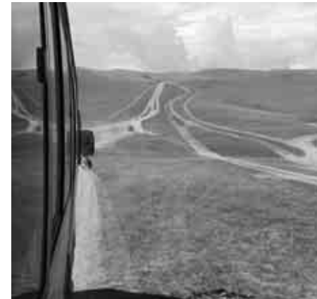
大草原が広がる絶景