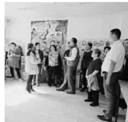
幼稚園視察の様子

勝央モンゴル交流協会 連載シリーズ 〜モンゴルへの旅〜 第2回「モンゴルの大草原とゲルでの宿泊」 モンゴル滞在2日目。今日は大草原に向けて出発です。 滞在先のホテルを後にした一行は、ウランバートルの西約230kmに位置するウブスハンガイ県の古都、カラコルムへと向かいます。 舗装されていた道路も郊外へ出ればその姿はありません。山あり川あり、車は大きく揺れます。車内は奇声と笑い声が絶えず、ある意味で楽しい冒険となりました。小休憩をはさみつつ、草原の中を走ること約6時間。やっと2日目の滞在先に到着です。 古都カラコルムでは、街の博物館やチベット仏教の寺院群「エルデン・ゾー」へ。世界遺産としても登録されている同所は、108個の白い仏塔で