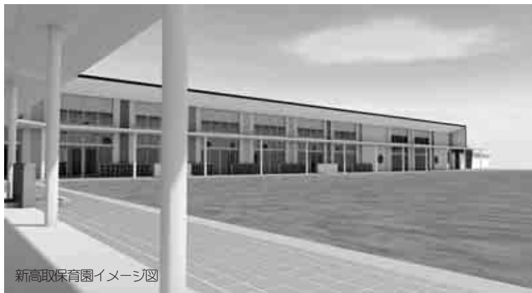
新高取保育園イメージ図