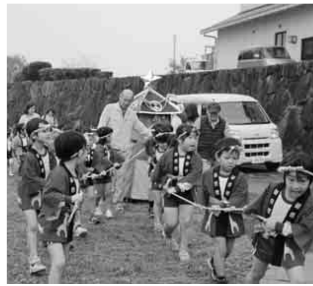
▲神輿を引っ張る年長組の園児たち