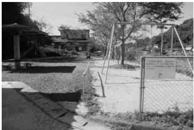
完成した遊具（全景）

広場内には、二人用ブランコ・一方滑り台・低鉄棒3欄製・一連シーソー・山型雲梯の5つの遊具 この事業は、宝くじの社会貢献広報事業として、宝くじの受託事業収入を財源として実施しているものです。