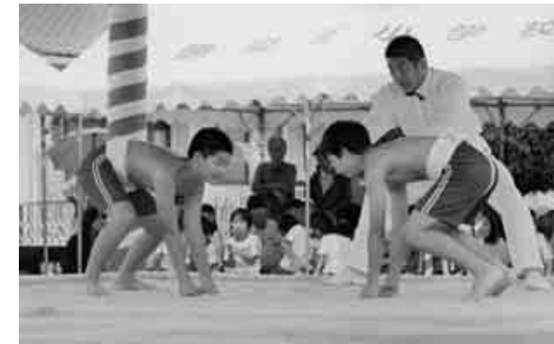
勝央北小学校角力大会