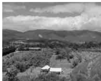
那岐山を望む栗畑の展望