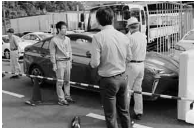
▲サポカーの説明を受ける参加者

これは美作警察署が自動車販売事業者と実施したもので、町内の高齢者や車両に関心のある人など14人が