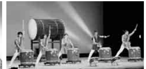
勝央金時太鼓保存会