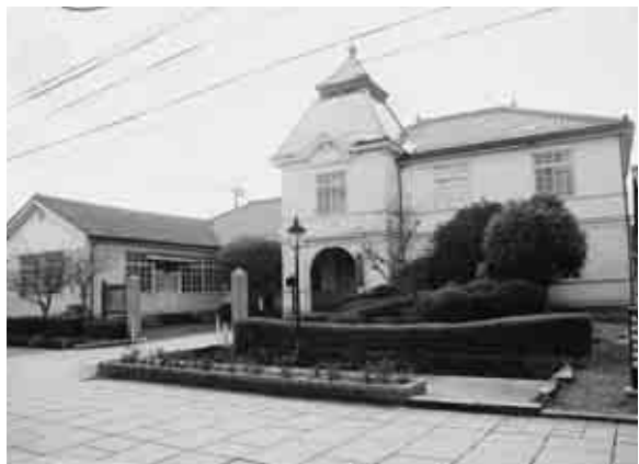
旧勝田郡役所庁舎

例年、9月の街道祭の期間中のみ公開していますが、このたび、おかやまの文化財一斉公開と文化財保護強調週間関連行事として、特別公開することになりました。 建物内部とともに、勝間田の「歴史展」や「企画展」「記念物100年展」も自由に見学できますので、お気軽にお越しください。町の文化財を身近に感じてください。歴史を知る機会と