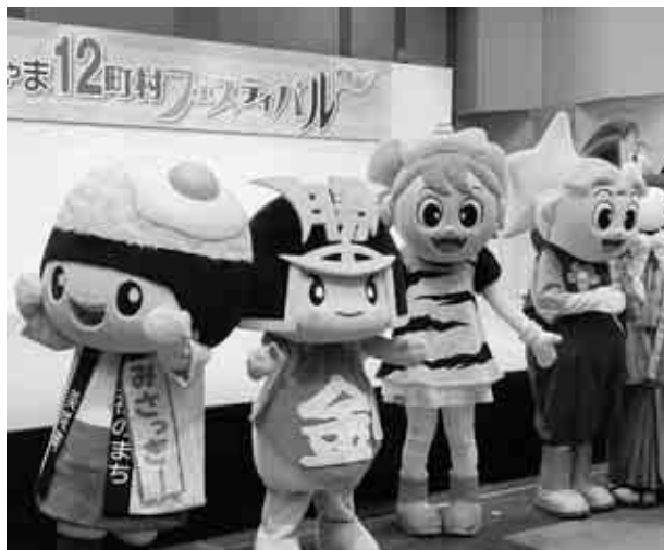
▲ゆるキャラも大集合！

きんとくんは来場者にも人気で、「かわいい」などと声を掛けられる場面もありました。