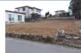
三重県津市(土地) 譲渡額約270万円