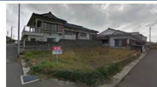
鹿児島県いちき串木野市(土地) 譲渡額約350万円