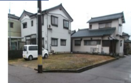
新潟県燕市(土地) 譲渡額約350万円