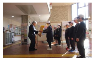
地域・ボランティア感謝状贈呈