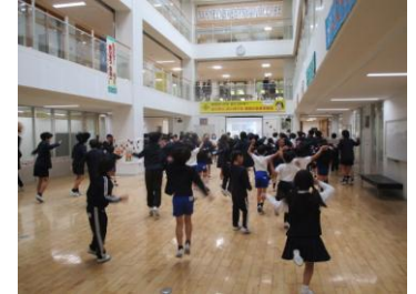
よっちょれ練習会