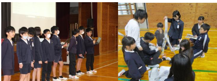
全校縦割り班遊び

学年末の6年生の姿です。笑顔いっぱいの学校にするために、活動を楽しみながら活躍してくれました。