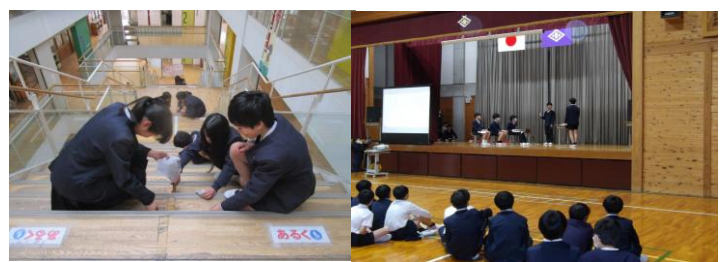
委員会活動・発表