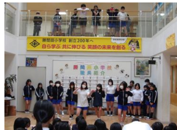
ダンスクラブ発表