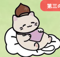
第三の居場所マスコットキャラクター