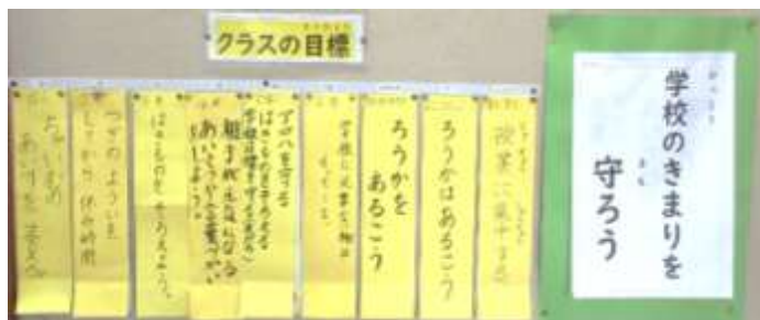
月目標をクラスで考えて取り組んで掲示しています