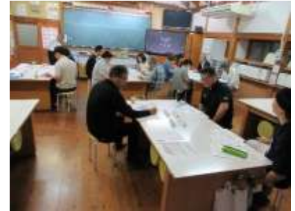
学校運営委員会の様子

勝央北小学校は、平成24年から勝央町教育委員会の指定を受けて学校運営協議会設置校、いわゆるコミュニティ・スクールになっています。