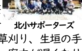
北小サポーターズ

北小サポーターズとして、5月17日（日）に、環境整備を行いました。当日集まってくださった皆さんで手分けして、校舎北側と5年生が稲作体験する田んぼの畦の草刈り、生垣の手入れを行っていただきました。ありがとうございました。案内が遅くなりご迷惑をおかけしました。来年度以降は、日を決めて早めのアナウンスを行っていく予定です。都合が付かれましたら、ぜひふるってご協力をよろしくお願いいたします。