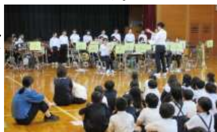
吹奏楽部による演奏